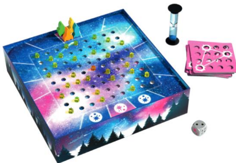
Príklad: Príprava hry pre 4 hráčov

Červené štartovacie políčko obežnej dráhy je označené šípku. Každý hráč si vyberie raketu a položí ju na štartovacie políčko. Guľaté karty sa použijú len pri druhom variante hry. Guľaté karty a zvyšné rakety odlož'te na bok. Zamiešajte hviezdne mapy a vytvorte z nich balíček. Nezáleží na tom, aká strana máp smeruje hore. Pripravte si presýpacie hodiny a kocku.