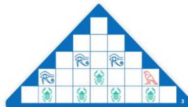
Chufu = náročné