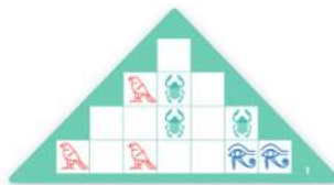
Stredne náročné karty faraóna Rachefa ★★