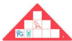
Ľahké karty faraóna Menkaurea ★

Priebeh hry: Vyberte si pyramídovú kartu s požadovanou úrovňou náročnosti.