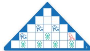
Náročné karty faraóna Chufua ★★★

Položte pred seba pyramídovú kartu a vedľa nej položte drevené dieliky potrebné pre danú úlohu.