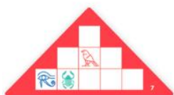
Menkaure = ľahké

Požadované dieliky podľa stupňa náročnosti: