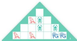
Rachef = stredne náročné