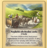
Nejdelší obchodní cesta